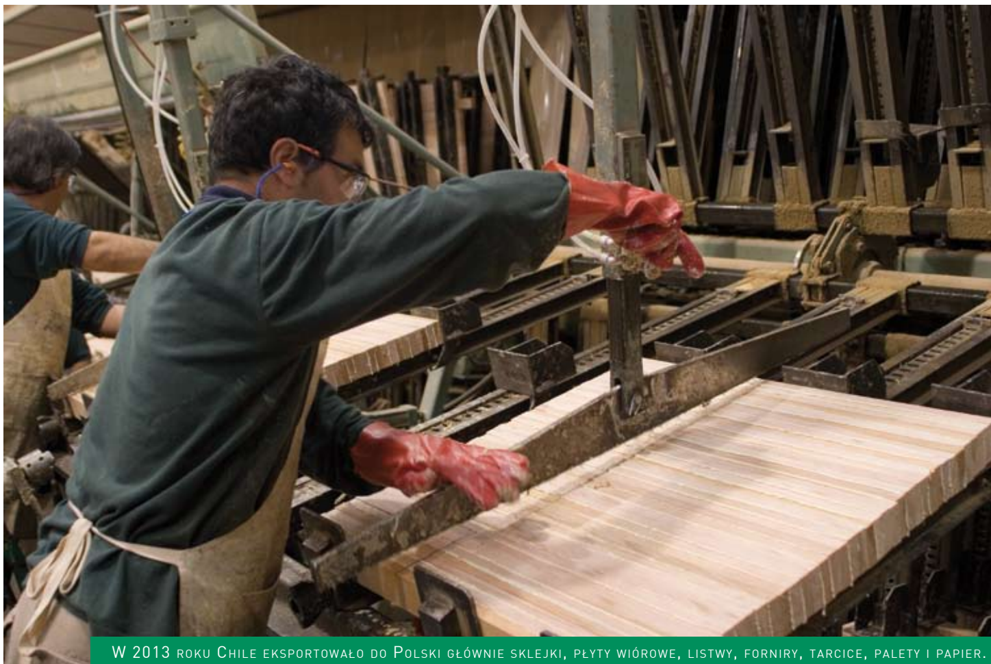
W 2013 roku Chile eksportowało do Polski głównie sklejki, płyty wiórowe, listwy, forniry, tarcice, palety i papier.

trudnienie 122 tys. pracowników, a także istnienie 180 tys. etatów pośrednich. W 2013 roku eksport osiągnął poziom 5,6 mld USD; głównymi odbiorcami były Chiny, Stany Zjednoczone i Japonia.