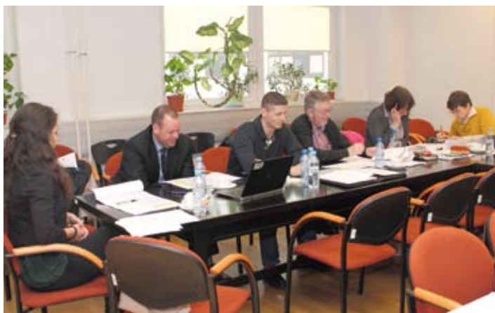
W MARCU BR. W WARSZAWIE ODBYŁO SIĘ CZWARTE SPOTKANIE ROBOCZE PROJEKTU BOLSTER-UPII.

Projekt potrwa do września 2015 roku. W marcu 2014 roku w Aachen (Niemcy) odbyło się drugie spotkanie dotyczące powyższego projektu, a we wrześniu 2014 roku planowane jest w Warszawie trzecie spotkanie projektu IQ for ECVET.