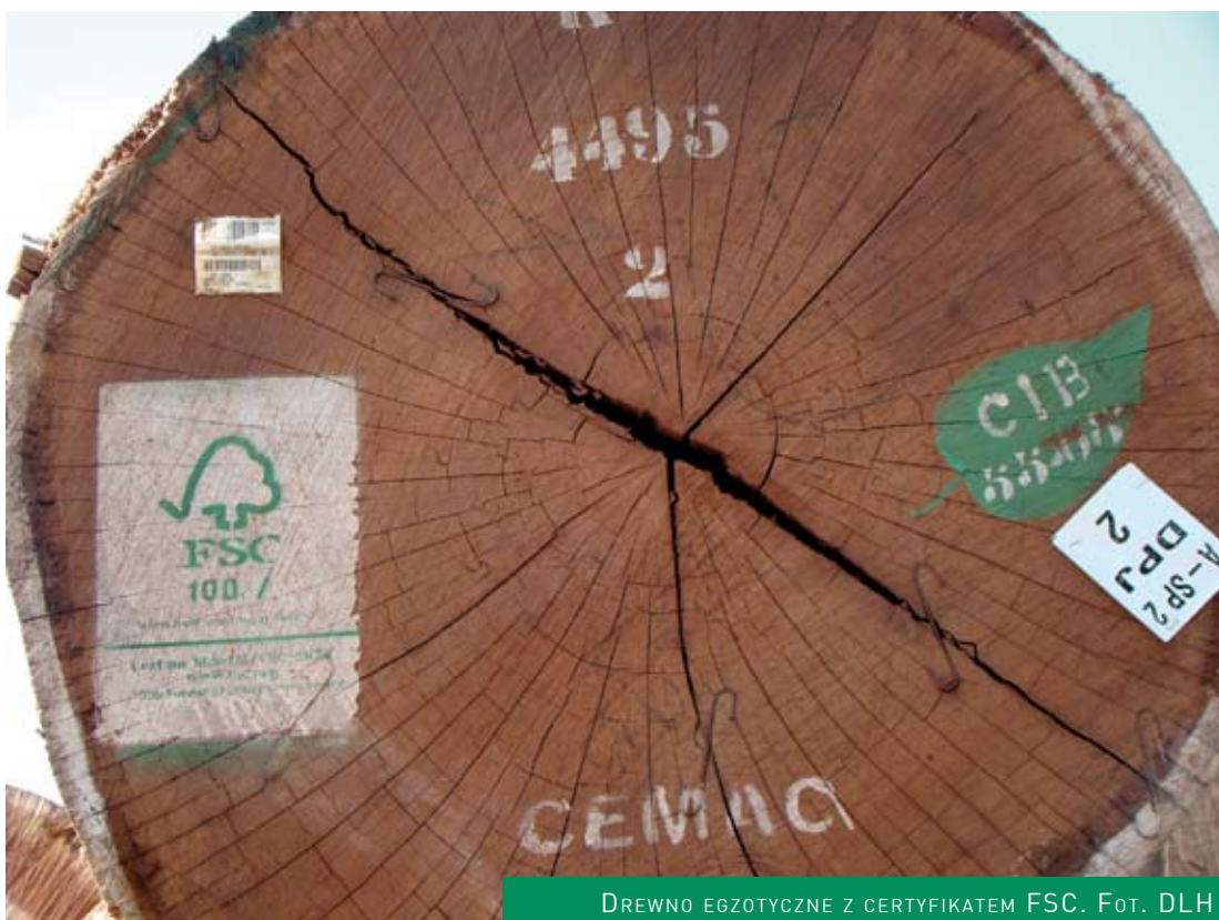
DREWNO EGZOTYCZNE Z CERTYFIKATEM FSC.

Międzynarodowy Instytut Outsourcingu, neronIT oraz Akademia Technologii przygotowały ofertę przeprowadzenia audytów i procesu certyfikacji – opracowanie i wdrożenie procedur oraz adekwatnego Systemu Kontroli Pochodzenia Produktu. Zapraszamy Państwa do współpracy, której celem ma być podniesienie konkurencyjności Państwa przedsiębiorstw na rynku meblarskim.