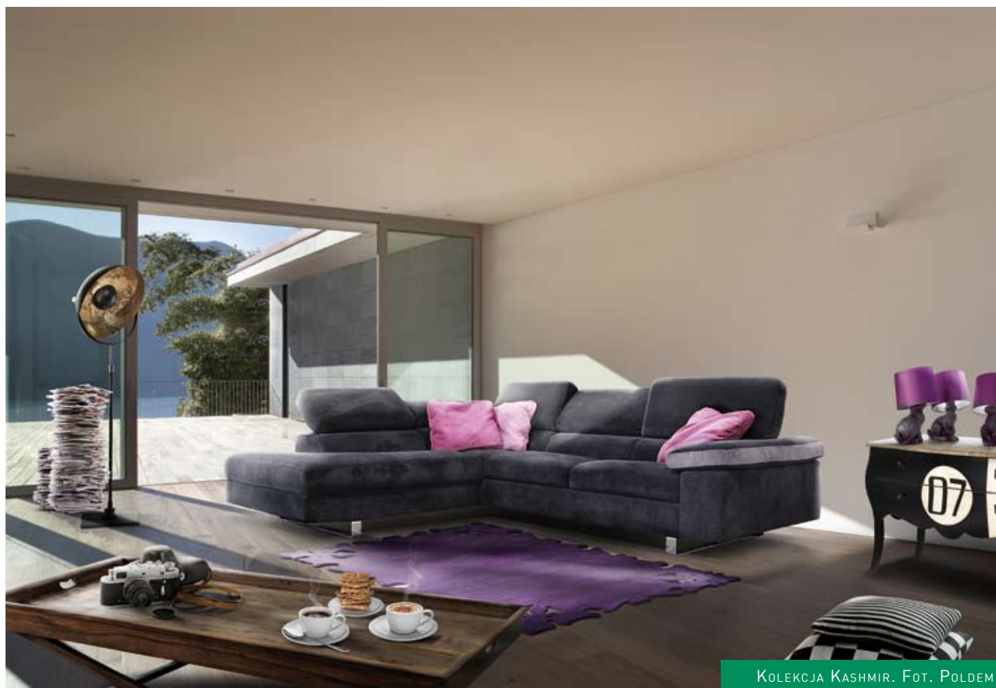
KOLEKCJA KASHMIR.