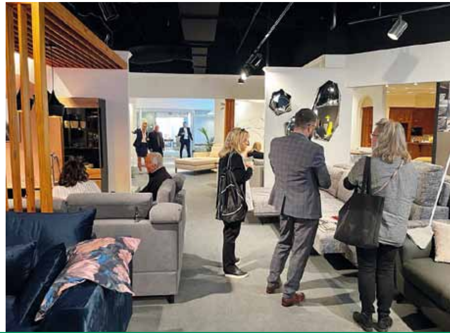
ZAINTERESOWANIE POLSKIMI MEBLAMI TO EFEKT PRACY POLSKICH PRODUCENTÓW NA RYNKU AMERYKAŃSKIM W OSTATNICH LATACH.

Część z nich to firmy, z którymi relacje nawiązaliśmy wcześniej i już z nimi współpracujemy. Zorganizowaliśmy też spotkania z nowymi kontrahentami, do których wkrótce rozpoczniemy dostawy. Moim zdaniem dobrze działa formuła polskiego stoiska agregującego różnych dostawców. Dzięki temu, oprócz budowania indywidualnego wizerunku każdej z firm, prezentujemy Polskę jako jednego z liderów produkcji i eksportu mebli na świecie.