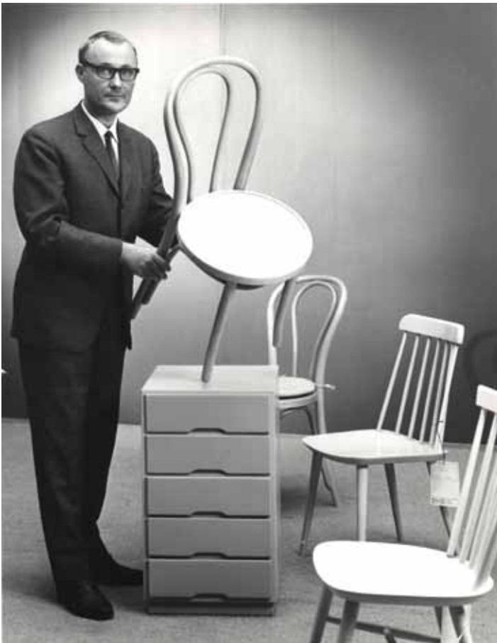
W POLSCE MAMY WIELU PRZYJACIÓŁ, KTÓRZY POSIADAJĄ WYJĄTKOWY DAR WYKORZYSTYWANIA W PRACY ZARÓWNO SERCA, JAK I ROZSĄDKU – MÓWIŁ INGVAR KAMPRAD, ZAŁOŻYCIEL MARKI IKEA.

na wspólnocie wartości oraz modelu biznesowego. Wszystkie relacje z partnerami cechuje wzajemny szacunek, zaufanie i transparentność. Czynniki stanowiące o sukcesie w przyszłości wynikają ze sposobu współpracy z dostawcami, a stosunki łączące ich z firmą IKEA prowadzą do lepszych produktów i usług przy obniżonym koszcie i krótszym czasie dostawy na rynek. W Polsce IKEA ma prawie 30 partnerów, z którymi działa już od ponad 20 lat i razem z nimi buduje tę niesamowitą historię.