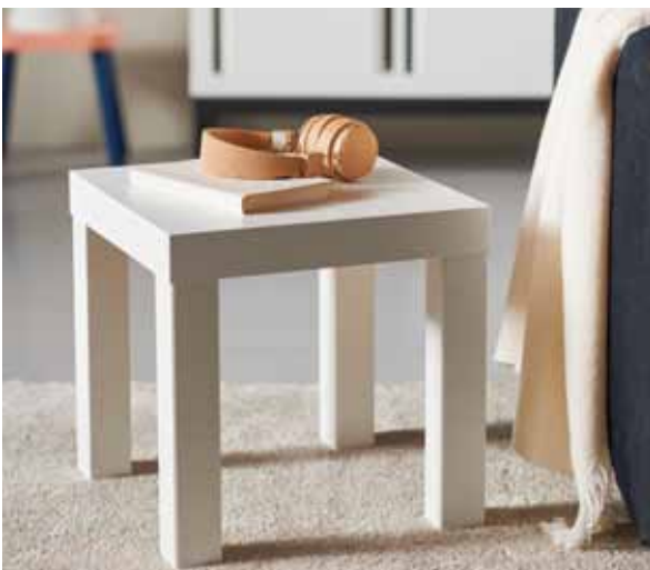
W NASZYM KRAJU PRODUKUJE SIĘ MIĘDZY INNYMI 63 PROC. KULTOWYCH FOTELI STRANDMON, 70 PROC. REGAŁÓW KALLAX CZY 67 PROC. STOLIKÓW LACK.

na wspólnocie wartości oraz modelu biznesowego. Wszystkie relacje z partnerami cechuje wzajemny szacunek, zaufanie i transparentność. Czynniki stanowiące o sukcesie w przyszłości wynikają ze sposobu współpracy z dostawcami, a stosunki łączące ich z firmą IKEA prowadzą do lepszych produktów i usług przy obniżonym koszcie i krótszym czasie dostawy na rynek. W Polsce IKEA ma prawie 30 partnerów, z którymi działa już od ponad 20 lat i razem z nimi buduje tę niesamowitą historię.