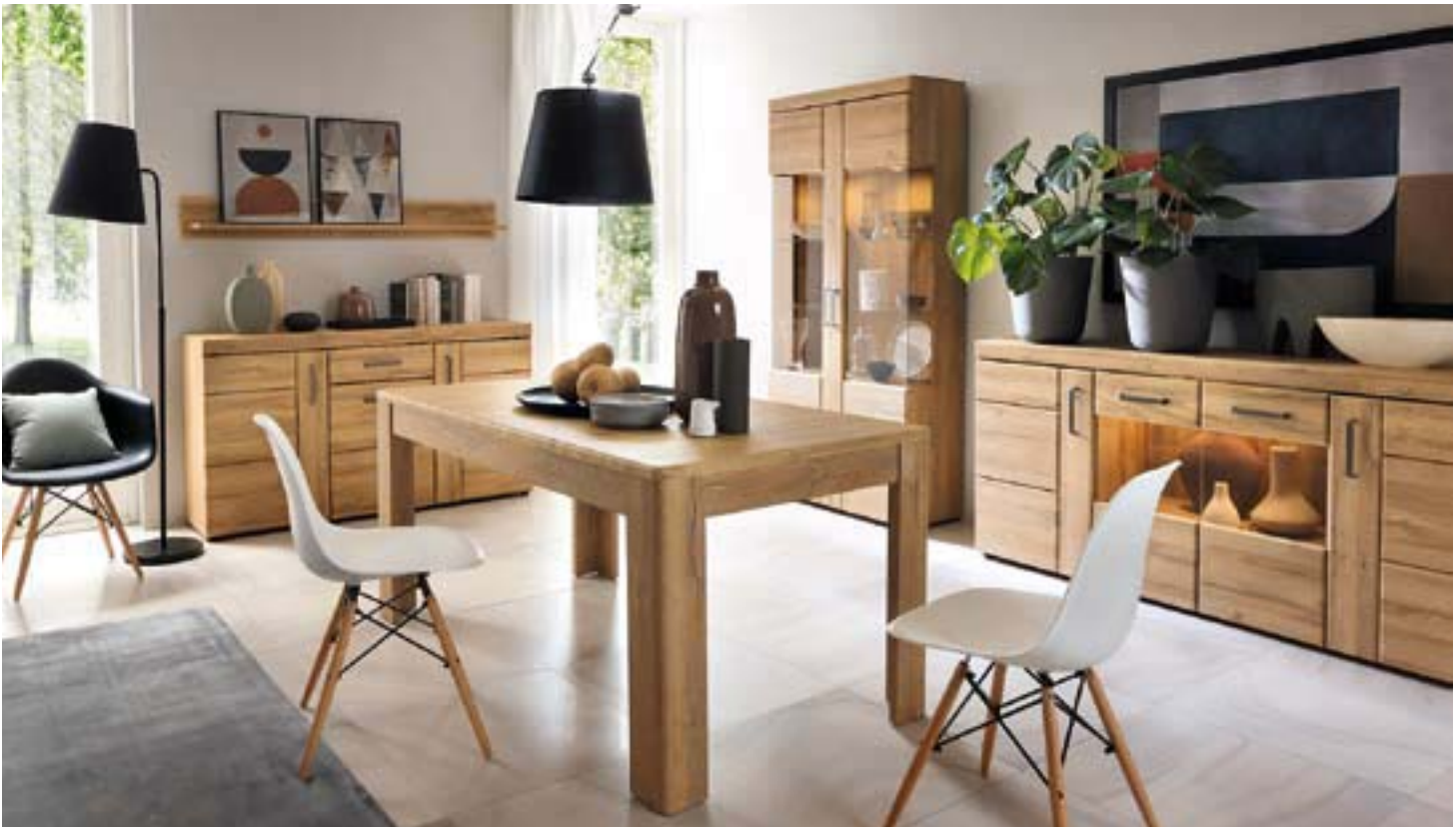
W POLSCE W DALSZYM CIĄGU ROZWIJA SIĘ PRODUKCJA NIEMAL WSZYSTKICH GRUP MEBLI. FOT. WÓJCIK FABRYKA MEBLI

i zatrudnia się coraz większą liczbę osób z Ukrainy i krajów egzotycznych. Oznacza to, że Polska przestaje być krajem tańszej siły roboczej, a nasz przemysł zdobywa rynki na świecie, dzięki swojej wysokiej jakości i rozwijającemu się marketingowi.