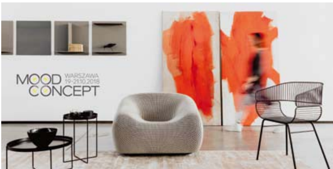
WYDARZENIE MOOD CONCEPT 2018 BĘDZIE PREZENTACJĄ WZORNICTWA NAJLEPSZYCH MAREK I PROJEKTANTÓW.

Gościem specjalnym MOOD CONCEPT 2018 będzie Ferruccio Laviani, charyzmatyczny designer i dyrektor artystyczny włoskiej marki Kartell, który poszukując nowych definicji przedmiotów i piękna, przełamuje konwenanse odważnymi, nietuzinkowymi formami mebli i oświetlenia. Wychowanek Ettore Sottsass – jednego z założycieli rewolucyjnej grupy Memphis – w świecie wzornictwa zaistniał projektem lampy Bourgie, będącej nowoczesną interpretacją klasycznych, bogato zdobionych, barokowych lamp. Pragnąc odczarować szarą rzeczywistość, pojawi się na scenie głównej targów, obok innych zaplanowanych prelekcji, specjalistycznych szkoleń i kreatywnych warsztatów, gdzie będzie nakłaniał publiczność do rewizji własnych poglądów i wspólnie z organizatorami promował oryginalny design na polskim rynku wnętrz.