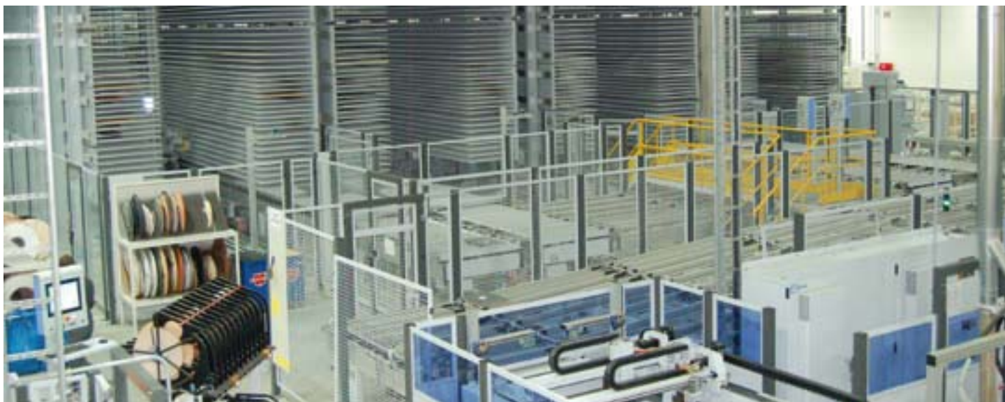
AUTOMATYZACJA I INFORMATYZACJA PROCESÓW PRODUKCYJNYCH I SPRZEDAŻOWYCH, A TAKŻE ICH WSPÓŁGRANIE W PRZEDSIĘBIORSTWIE SĄ KONIECZNE, ABY POLSKIE PRZEDSIĘBIORSTWA MOGŁY KONKUROWAĆ NA ZAGRANICZNYCH RYNKACH.

punktu widzenia nieodzowne jest wykorzystanie dobrodziejstwa, jakim jest Internet. Podstawowym elementem prezentacji produktów jest atrakcyjna, responsywna (to znaczy poprawnie wyświetlająca się na urządzeniach mobilnych) strona internetowa. Bezpośrednim miejscem sprzedaży realnych towarów w świecie wirtualnym jest sklep internetowy. Warto także rozpoznać temat tzw. B2B marketplace – giełd, na których spotykają się producenci i hurtowi odbiorcy mebli. O tych narzędziach pisałem w poprzednim numerze „Biuletynu”.