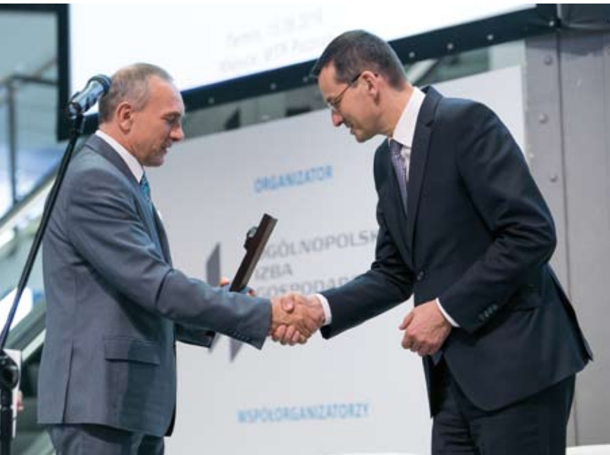
DZIAŁANIA IZBY NA SZCZEBLE RZĄDOWYM I SAMORZĄDOWYM PRZYCZYNIŁY SIĘ DO WIĘKSZEGO ZAINTERESOWANIA MEBLARSTWEM WŚRÓD PRZEDSTAWICIELI WŁADZ PAŃSTWOWYCH.

rozpoczęte w roku 2015 działania, powyższą sprawą OIGPM w okresie sprawozdawczym starała się zainteresować szerzej Ministerstwo Rozwoju, Ministerstwo Energii, a także współpracowała ściśle z Instytutem Technologii Drewna w Poznaniu. Jednym z efektów tych działań było przedstawienie powyższego problemu na forum MR w dniu 7 lutego 2017 r. podczas spotkania dotyczącego barier prawnych, z jakimi styka się na co dzień branża meblarska. Ponadto w roku 2016 OIGPM zaangażowana była w kwestie związane z uregulowaniem spraw związanych z tak zwanym drewnem energetycznym. Powrót do procesu subwencjonowania przemysłowego spalania drewna na cele energetyczne mógłby bowiem spowodować pogłębienie istniejącego, bardzo poważnego deficytu tego surowca na polskim rynku, który w pierwszym rzędzie obejmuje drewno średniowymiarowe.