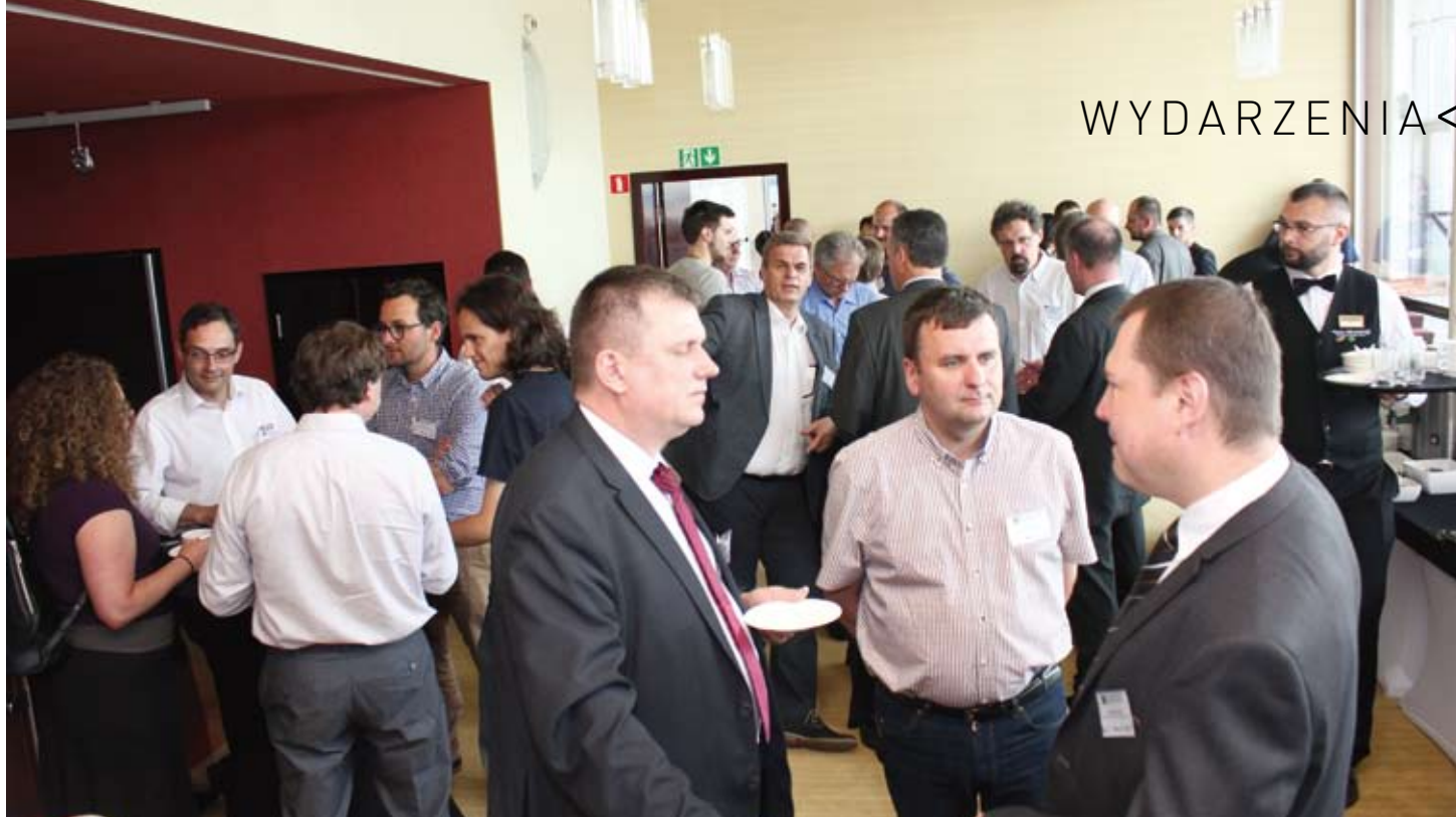
JAK NA KAŻDEJ KONFERENCJI, TAKŻE I PODCZAS INTERNATIONAL WOOD MACHINING SEMINAR CIEKAWY ROZMOWY TOCZYŁY SIĘ W KULUARACH.