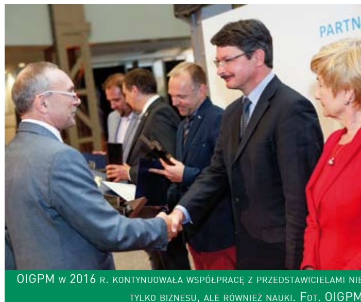
OIGPM w 2016 r. kontynuowała współpracę z przedstawicielami nie tylko biznesu, ale również nauki.

W związku z tym celem nadrzędnym projektu jest rozwój nowych metod badawczych. Ponadto jednolite i jasno sprecyzowane metody badawcze pozwolą prawidłowo sklasyfikować produkt i oszacować jego żywotność. Umożliwią dokładną i szybką ocenę jakości wykończeń, a tym samym ułatwią producentom