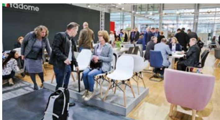
TARGI ODWIEDZILI KUPCY MEBLOWI Z 53 KRAJÓW.