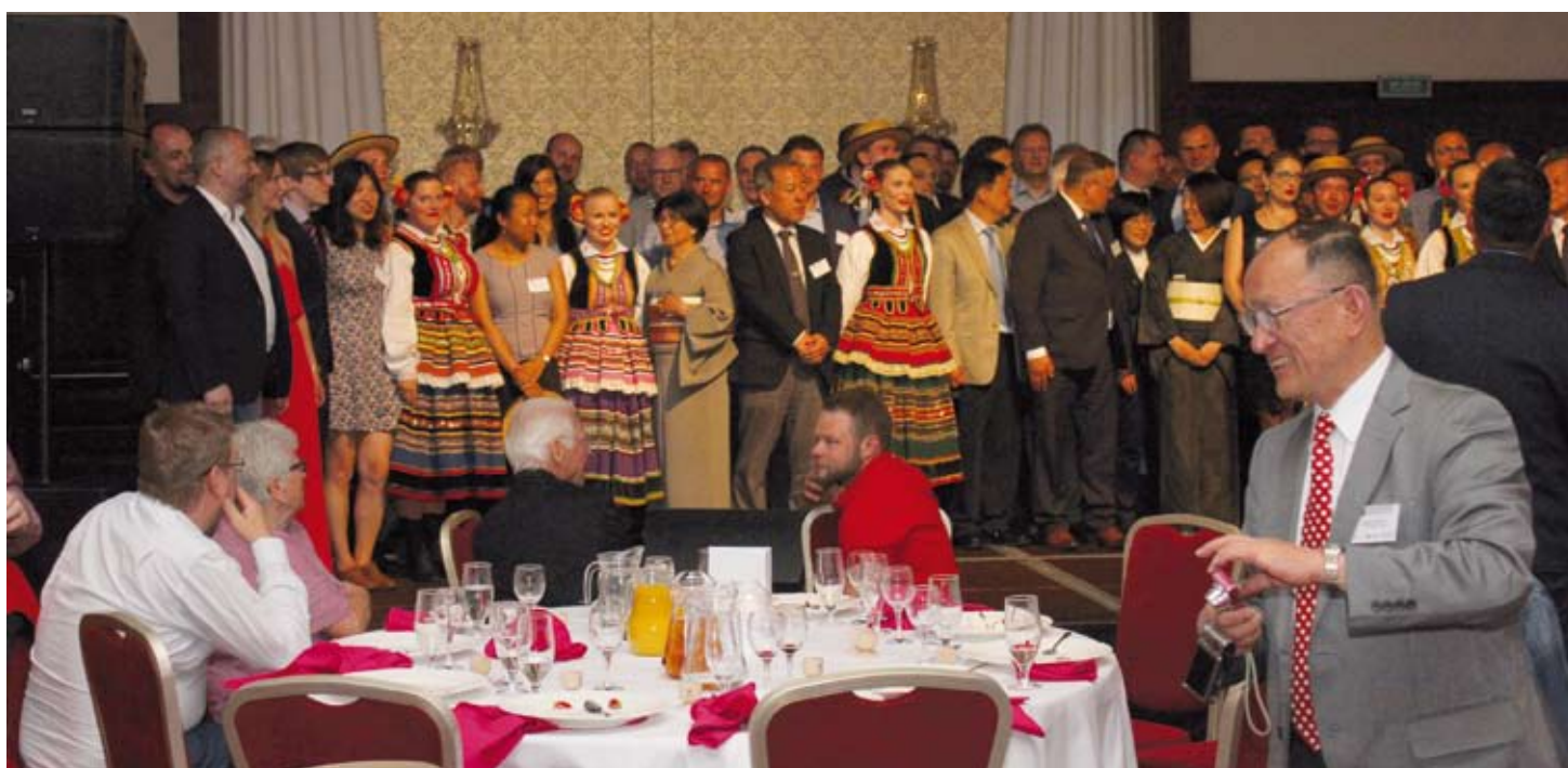
SEMINARIUM IWMS MIAŁO MIĘDZYNARODOWY I WIELOKULTUROWY CHARAKTER.