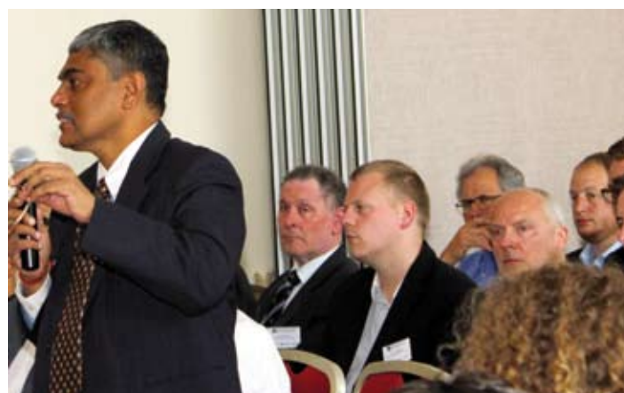
IWMS TO DOSKONAŁA OKAZJA DO PROMOCJI DOROBKU POLSKIEGO PRZEMYSŁU DRZEWNEGO I MEBLARSKIEGO, ZARÓWNO NA RYNKU KRAJOWYM, JAK I MIĘDZYNARODOWYM.