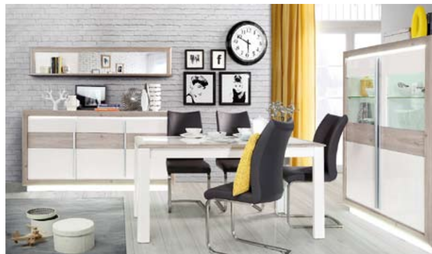
WEDŁUG GUS ODNOTOWANO WZROST WOLUMENU PRODUKCJI MEBLI DREWNIANYCH STOŁOWYCH I DO SALONÓW.

3 671 022,00 euro. Oznacza to dalszy rozwój naszej branży, a wiąże się z promocją naszych marek na rynkach zagranicznych. Ważnym wydarzeniem reklamującym są targi Meble Polska odbywające się w Poznaniu. W marcu Międzynarodowe Targi Poznańskie odnotowały wzrost zwiedzających z zagranicy aż o 11,3 % w stosunku do roku 2016. Najwięcej gości z zagranicy przybyło z Niemiec, poza tym zwiedzający przyjechali z Estonii, Finlandii, Grecji, Irlandii, Izraela, Malty, Niemiec, Norwegii, Rumunii, Słowacji, Słowenii, Turcji, Węgier oraz Zjednoczonych Emiratów Arabskich.