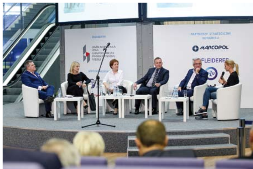
W 2016 ROKU OIGPM BYŁA ORGANIZATOREM ORAZ WSPÓLORGANIZATOREM 9 KRAJOWYCH SEMINARIÓW ORAZ KONFERENCJI.

OIGPM kontynuowała również swoje zaangażowanie w prace związane z klasyfikacją pozostałości z obróbki płyt drewnopochodnych i drewna klejonego. Dostrzeżono bowiem konieczność prawnego uregulowania problemu spalania drewna i jego pochodnych, w tym odsortów z płyt drewnopochodnych oraz konieczność znalezienia rozwiązań odpowiadających wymogom dyrektywy o emisjach przemysłowych, a także potrzebom gospodarki. Kontynuując