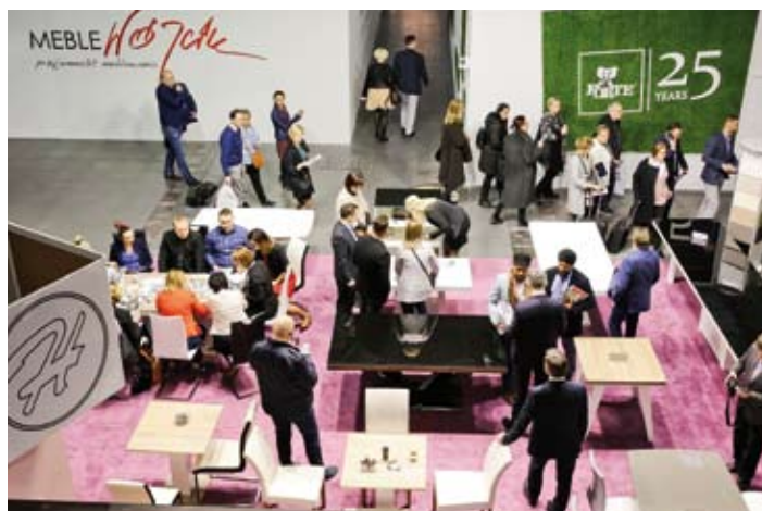
BLOK TARGÓW MEBLE POLSKA / HOME DECOR / ARENA DESIGN ODWIEDZIŁO W TYM ROKU PONAD 21 000 PROFESJONALNYCH ZWIEDZAJĄCYCH.