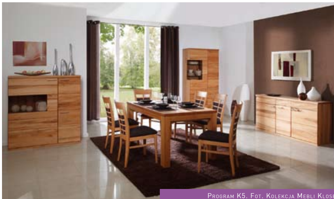
PROGRAM K5.

może znaleźć coś dla siebie – stały się kwintesencją współczesnego stylu, również w odniesieniu do propozycji inspirowanych naturą. Wśród mebli z litego drewna oprócz projektów na wskroś nowoczesnych znaleźć można kolekcje, które z łatwością wpiszą się w klimat wiejskich posiadłości czy sielskich dworców. Pozbawione wyszukanych zdobień, z powodzeniem łączą tradycję z tym, co zawsze aktualne. A dzięki starannie przemyślanym detalom, są niezwykle efektowne. Jednym z takich programów jest, wykonana z litego drewna brzozy, linia Windsor firmy Kłose. Angielska z nazwy, z przekorą nawiązuje do klimatu Prowansji. Świeża, odrobinę romantyczna, ciepła i przytulna. To kolekcja, która wnosi do codziennej rzeczywistości użytkowników atmosferę relaksu i wygody.