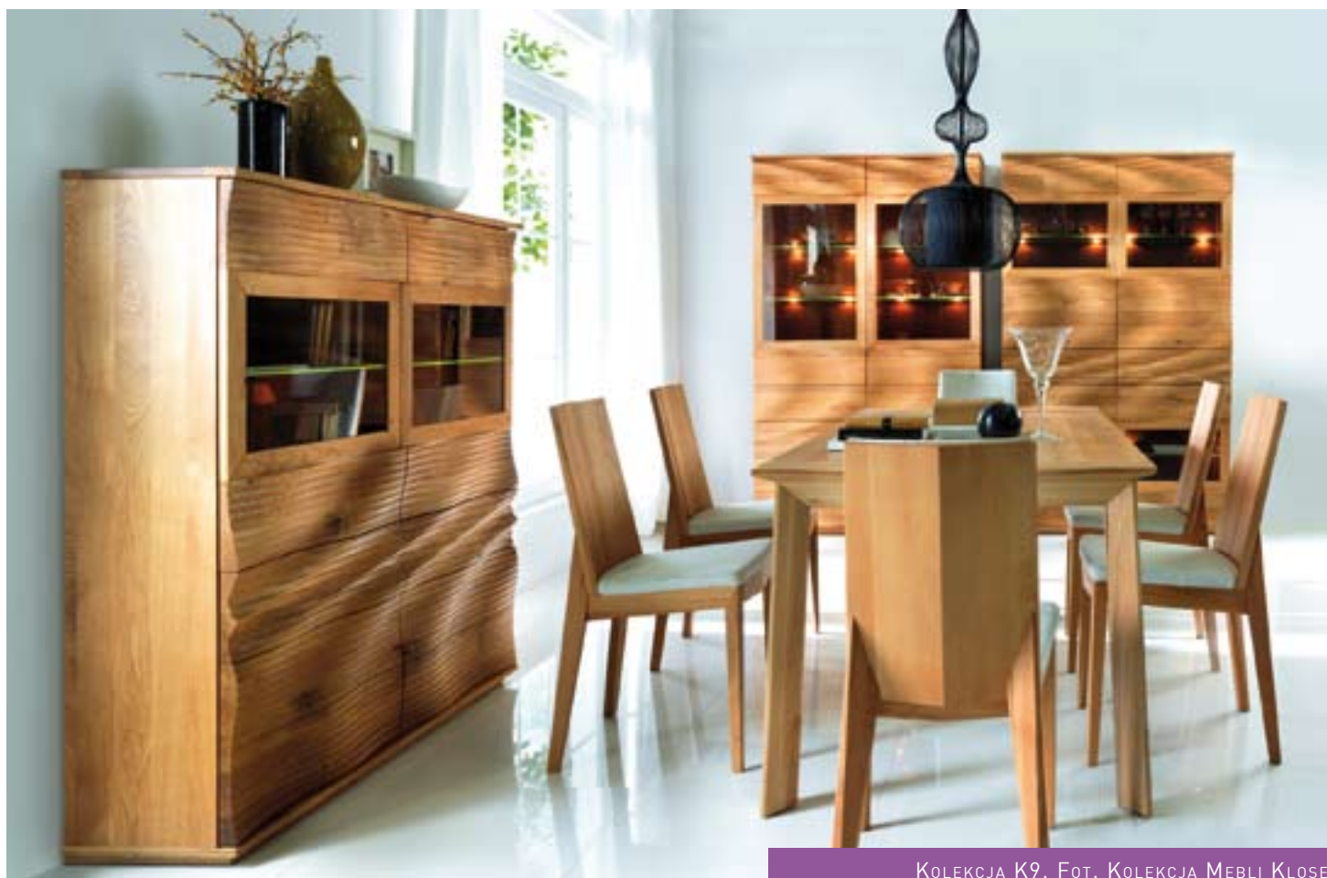
KOLEKCJA K9. FOT. KOLEKCJA MEBLI KLOSE

Indywidualizm, różnorodność i urozmaicenie sprawiające, iż każdy