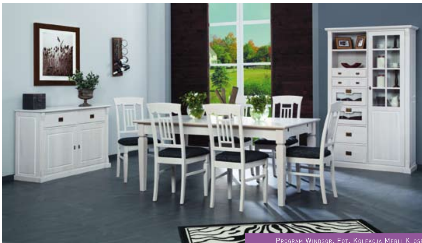
PROGRAM WINDSOR. FOT. KOLEKCJA MEBLI KŁOSE

Meble z litego drewna sprawdzą się w dowolnej estetyce i w każdej przestrzeni, i nawet po wielu latach zachowają swój klimat oraz niepowtarzalny urok i klasę. To meble, które – podobnie jak wino – z upływem lat nabierają smaku, szlachetnej „nuty”, której próżno szukać w meblach ze szkła czy stali.